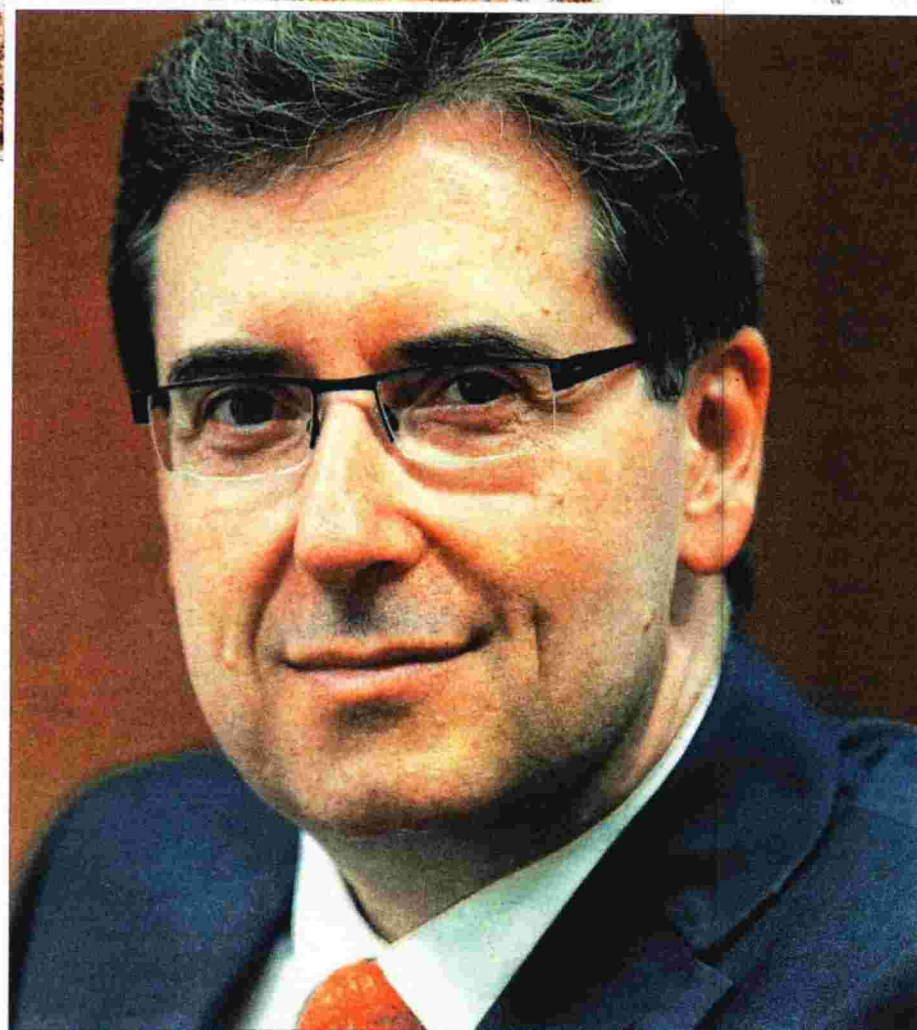
Ο περιφερειάρχης Δυτικής Μακεδονίας Γιώργος Δακίς

Δυστυχώς ουδείς μπορεί να ισχυριστεί ότι υπάρχουν ευδιάκριτα και απτά σημάδια ανάκαμψης της οικονομίας σε περιφερειακό επίπεδο. Να μην ξεχνάμε ότι η Δυτική Μακεδονία, η μοναδική αμιγώς ηπειρωτική Περιφέρεια της χώρας και χωρίς πρόσβαση σε θάλασσα, εξ αντικειμένου δεν αποτελεί ανταγωνιστικό θερινό τουριστικό προορισμό. Αυτό σημαίνει ότι η Περιφέρειά μας δεν είχε τη δυνατότητα να ωφεληθεί άμεσα από τη θεαματική αύξηση της τουριστικής κίνησης της φετινής περιόδου, να μειώσει έστω εποχικά την ανεργία και να αυξήσει τα τοπικά εισοδήματα. Ακόμη και η πρόσκαιρη δυνατότητα απα-